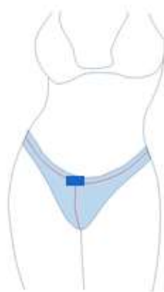
Rysunek 2. Położenie korpusu ATOs-a

W zależności od budowy anatomicznej czujnik termometru jest dłuższy lub krótszy.